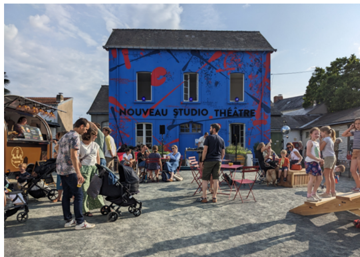
Fête avec de la Musique #2 - juin 2022