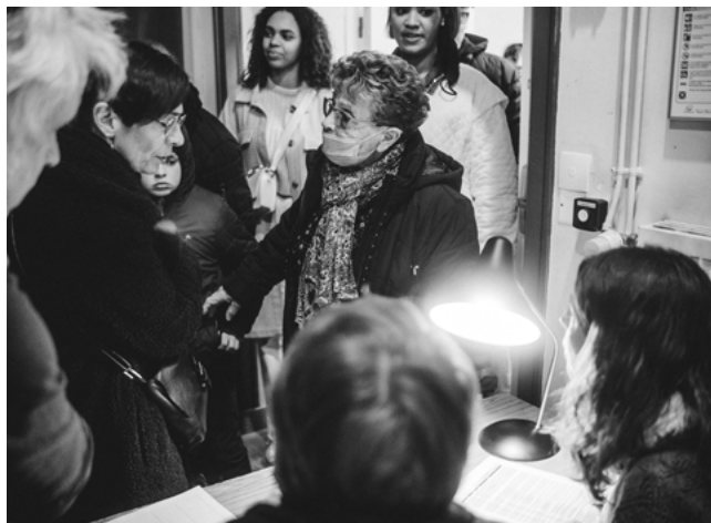
Accueil du public Le monde ou rien / Biche prod - avril 2022 © Serguey Varenne