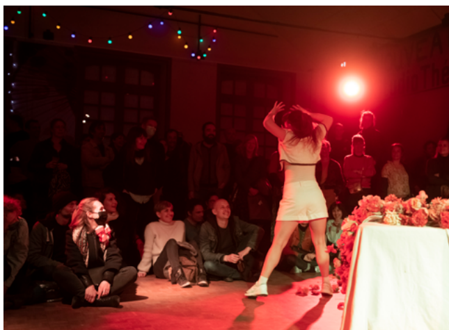
Crémaillère - février 2022

Depuis 2021, le Nouveau Studio Théâtre est ouvert au bénévolat et compte aujourd'hui une quinzaine de bénévoles qui donnent de leur temps avec enthousiasme et s'investissent dans la vie culturelle du lieu.