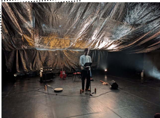
Carte blanche à Majnun / La Réciproque - juin 2023

C'est un lieu ouvert sur son quartier et accessible à tous les publics, dynamique et innovant dans la relation qu'il propose au territoire et que nous vous invitons à rejoindre en tant que mécène.